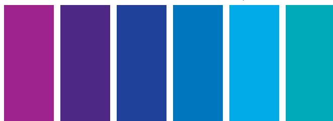
398 A □ Mauve Mauve Malva