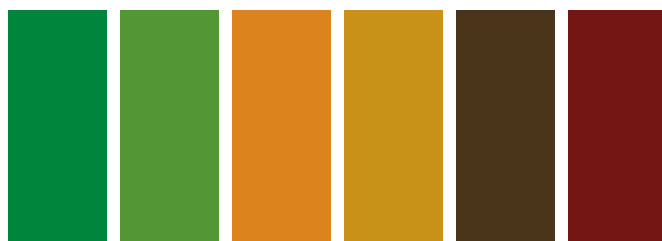
314 A □ St Hooker's Green Light Vert de Hooker Clair Verde de Hooker Claro