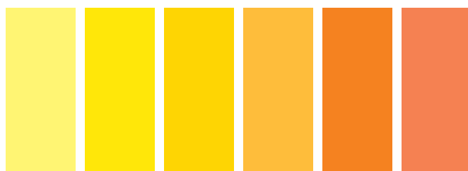
346 A □ Lemon Yellow Hue Nuance de Jaune Citron Tono de Amarillo Limón